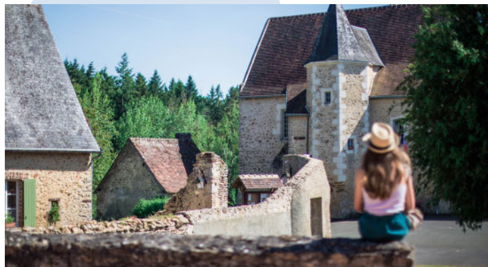
Village de Conflans-sur-Anille

👉 Rendez-vous place de l'église à Rahay à 14h30 / Gratuit