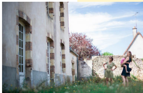
Presbytère à Vibraye

♥ Rendez-vous aux forges de Champrond à 10h45 / Tarif : 25€ / Limité à 25 personnes / Inscription avant le 30 juillet.